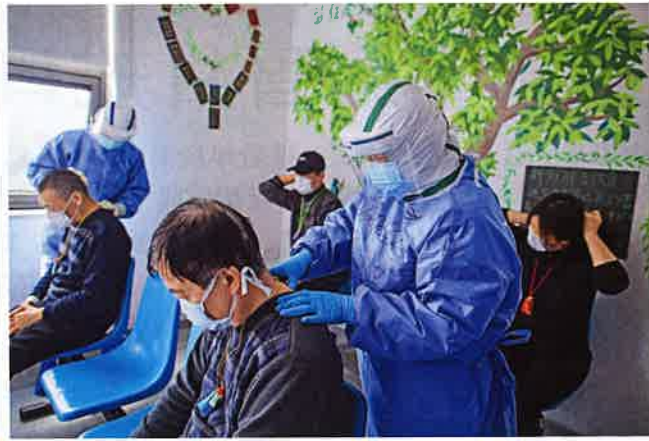
▲3月19日，在湖北省武漢市肺科醫院隔離病房，內蒙古醫療隊隊員通過教授患者八段錦、經絡拍打、穴位按摩等中醫傳統方法，幫助患者減輕頭痛等症狀，提高患者睡眠質量，恢復胃腸功能。

Pharmacological Research (《藥理學研究》) 接受在網上刊出名為〈Lianhuaqingwen exerts antiviral and anti-inflammatory activity against novel coronavirus (SARS-CoV-2)〉(〈連花清瘟對新型冠狀病毒具有抗病、抗炎作用〉) 的研究文章。研究利用 Vero E6 細胞，評估「連花清瘟」對新冠病毒的抗病毒活性，發現該方在 mRNA 水平上顯著抑制 SARS-CoV-2 在 Vero E6 細胞中的複製，並顯著降低由新冠病毒感染誘導的促炎細胞因子(例如腫瘤壞死因子 TNF- \alpha 和白細胞介素 IL-6 等)的產生，並對這些因子過度表達有抑制作用。結果顯示「連花清瘟」可以抵抗病毒攻擊，有望用於控制新冠肺炎。